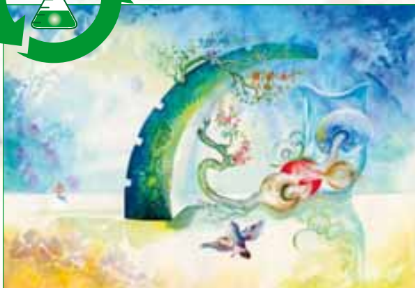
Nori, Firoz: Chemie-Augenblicke, 2003